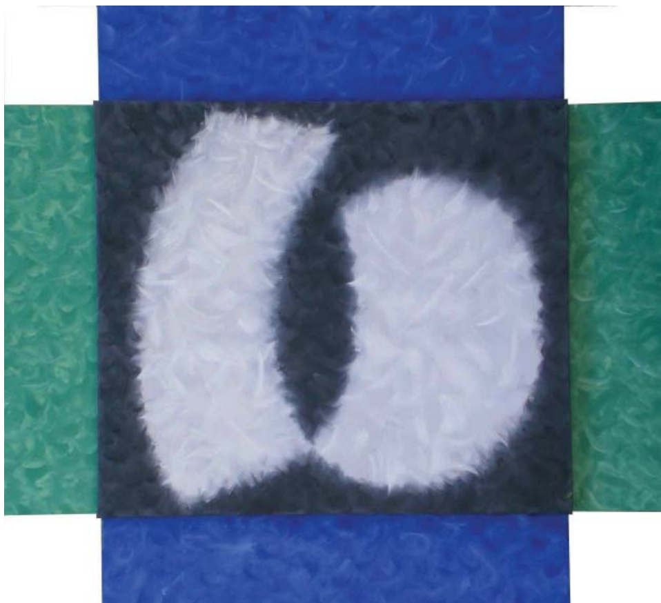
Mihai Țăruș. Nodul gordian , asamblaj-5 piese, u/p, 1060×1150×50 mm, 2007

Până în prezent, pe teritoriul republicii s-au păstrat doar câteva nume de sate dintre cele existente cândva: Zăbriceni (rn. Edineț), Zămbreni (rn. Ialoveni), Zubrești (rn. Strășeni).